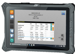
TABLETTE 10" Ref: TAB-XMA10-W10IOT

Kit alignement de remorque - Ref: AMCB46DW87193