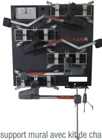
1 support mural avec kit de charge Ref. : WDSUPMUR