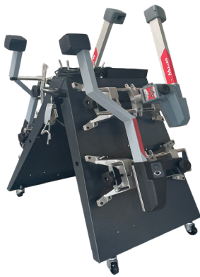
1 support mobile avec kit de charge Ref. : WDSUPMOB