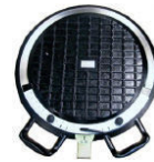
2 Plateaux pivotants PL Ref: AM14432X2

Kit alignement de remorque - Ref: AMCB46DW87193