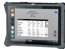
TABLETTE 12" Ref: TAB-XLA12-W10IOT

La solution de diagnostic Multimarque pour plus de performance :