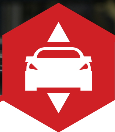
TABLE ÉLEVATRICE ÉLECTROHYDRAULIQUE