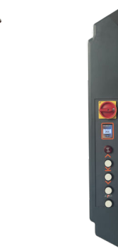
Coffret de commande avec afficheur